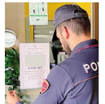
Il locale chiuso in via Gambirasio

Alla richiesta degli agenti di seguirli per notificare un foglio di via a carico di uno di loro, hanno reagito violentemente, aggredendo i poliziotti delle Volanti della Questura e rompendo un vetro dell'auto di servizio. Due cittadini d'origine sudamericana sono stati arrestati nella notte tra venerdì e ieri nell'ambito di un controllo del territorio dovuto ad una segnalazione per disturbo alla quiete pubblica presso un locale di via Gambirasio alla Malpensata. La titolare del bar, imparentata con i due, ha aggredito a sua volta i poliziotti. L'arresto è stato convalidato ieri mattina durante l'udienza di fronte al giudice: ai soggetti è stata applicata la misura del divieto di dimora nella Bergamasca, mentre è stato notificato un avviso orale del Questore a carico di uno dei due. La donna è stata invece indagata in stato di libertà per resistenza a pubblico ufficiale. Il questore ha adottato un provvedimento di chiusura del locale per 15 giorni.