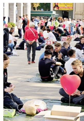
I ragazzi sul Sentierone BEDOLIS

La giornata è iniziata con un corso all'auditorium dell'Opera