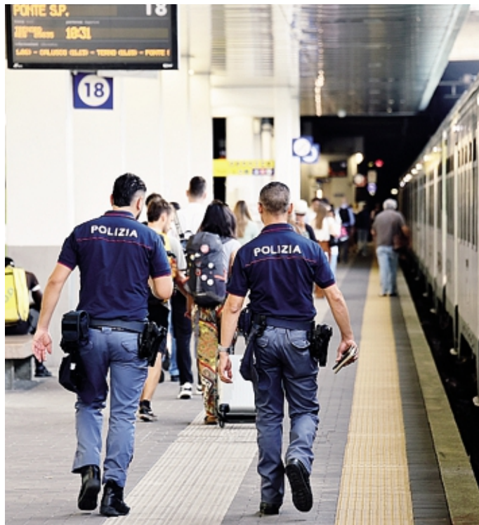
I controlli della polizia alla stazione in un'immagine d'archivio

Tra queste, c'è anche un cittadino 26enne originario del Gambia, irregolare sul territorio nazionale e senza fissa dimora, che è stato tratto in arresto perché trovato in possesso di 82 grammi di hashish. Nei confronti del giovane, già gravato da precedenti specifici, la Divisione anticrimine ha emesso la misura di prevenzione dell'avviso orale a seguito del giudizio di convalida, in cui veniva disposto il divieto di dimora a Bergamo e concesso il nulla osta all'espulsione. Il 26enne gambiano è stato quindi